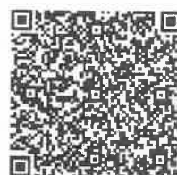
↑ Zoom講演会 申込QRコード